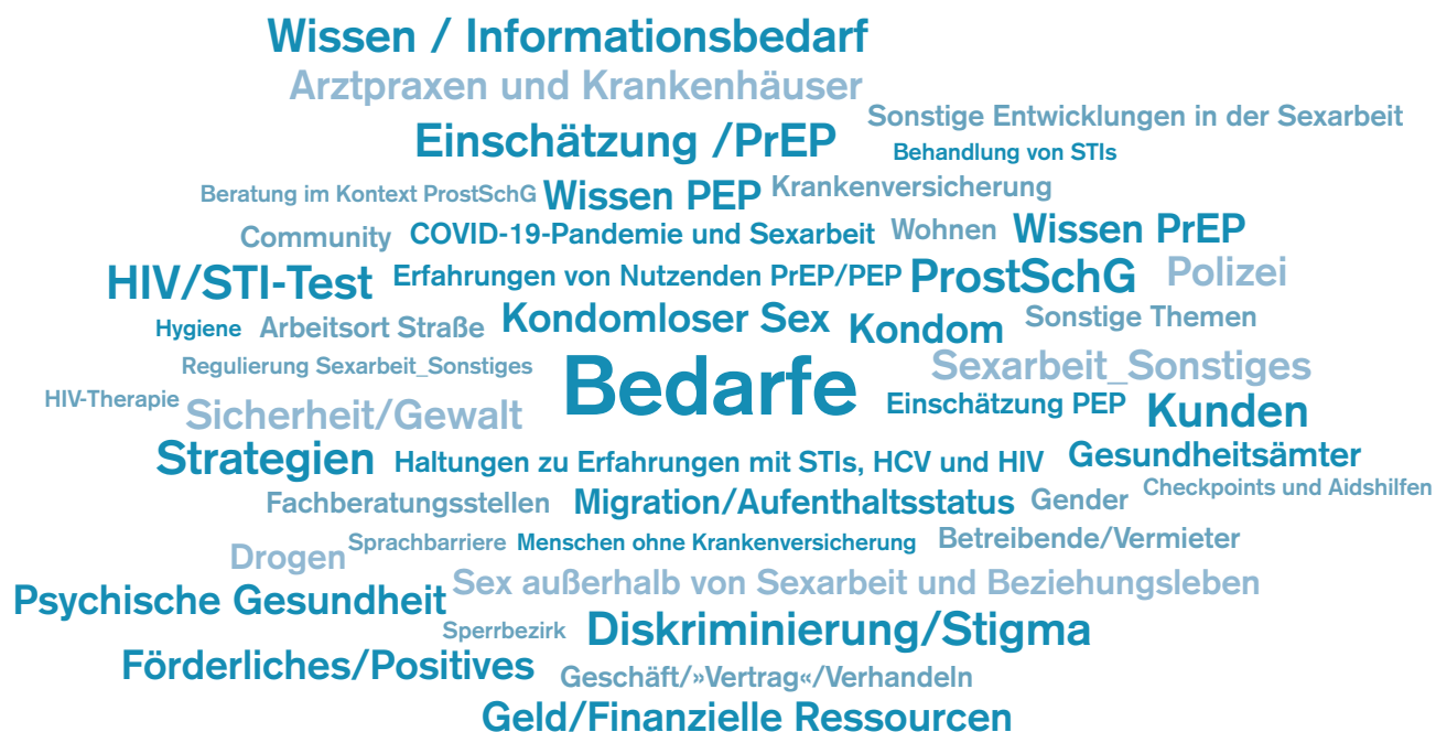
Abbildung 3: Codewolke Darstellung der am häufigsten zugeordneten Kategorien

Bei einem zweitägigen Auswertungsseminar mit den Peer-Forscher*innen im Juli 2023 wurde die Interpretation der Daten kritisch diskutiert. Dieses Treffen war auch Ausgangspunkt der Entwicklung von Empfehlungen zur Verbesserung der Gesundheits-, Arbeits- und Lebensbedingungen von Sexarbeiter*innen (→ Kap. 6). Bei einer erneuten Sitzung mit dem Projektbeirat im September 2023 wurden die Ergebnisse diskutiert und kommunikativ validiert.