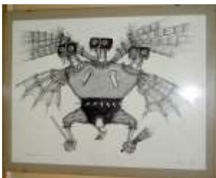
Nicht eindeutig zuordenbare Werke: