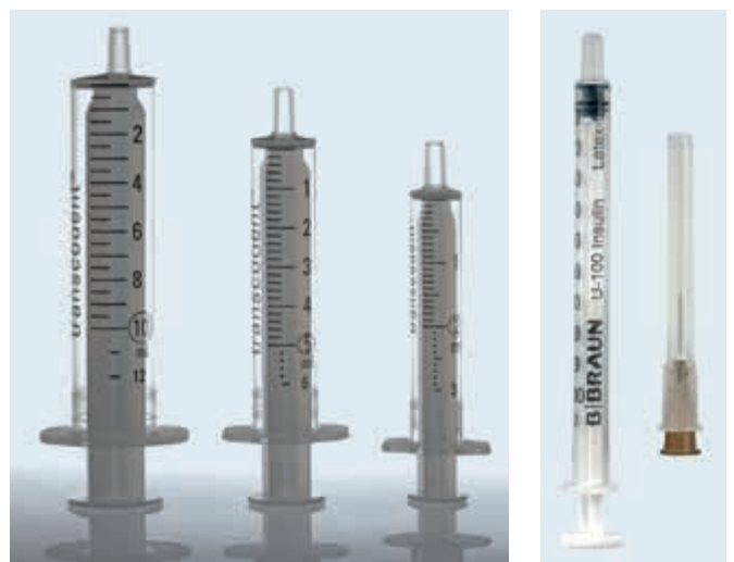
Abbildung 4 und 5: Beispiele von HDS Spritzen