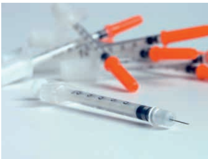
Abbildung 3: Beispiel einer LDS Spritze