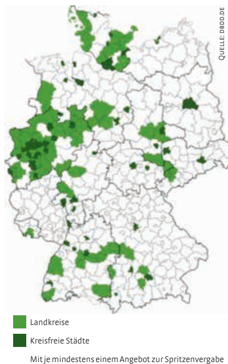
Abbildung 2: Verfügbarkeit von Maßnahmen zur Spritzenvergabe (inklusive Automaten) auf kommunaler Ebene auf Basis der Angaben der Länderexperten sowie einer ergänzenden Telefon und Internetrecherche

Kaum zu glauben? Sieht man sich die Ergebnisse im Abschlussbericht der Studie „Prävention von Infektionskrankheiten bei injizierenden Drogenkonsumenten in Deutschland“ an, die 2011 gefördert vom Bundesministerium für Gesundheit und vom IFT durchgeführt wurde, so erhält man erstmals einen wirklichen Einblick über die Zugänglichkeit zu sterilem Spritzbesteck in Deutschland (Abbildung 2)