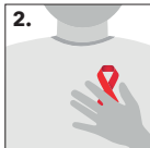
2. Schleife ankleben