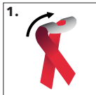
1. Schleife abziehen